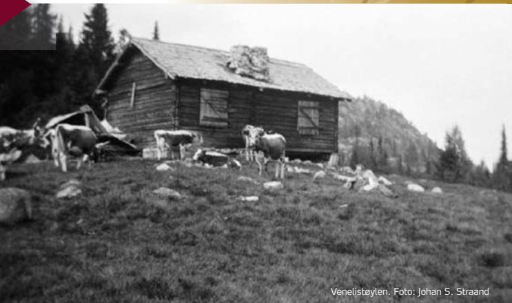
Venelistøylen.

VENELIFJELLET – som tyder "det vakre fjellet" – ber namnet med rette og er eit ynda turmål i Vrådal. Venelifjellet fekk namnet frå ei buedeie som tykte det var så vakkert. Kvar sommar gjette ho buskapan sin ved Venelistøylen. Kvar gard hadde ein eller fleire støylar. Det bratte og karrige landskapet gjorde det naturleg å leggje støylane spreidd. På den måten utnytta dei beitet betre. Støylslivet var difor eit nomadeliv. Støylen hadde fram til 1930-åra ein sentral plass i gardsdrifta i Vrådal. Venelistøylen er sikra for ettertida, og støylsbua på Veneli syner korleis buone såg ut då dei var i bruk. Støylsbua vart bygd i 1894 og restaurert 100 år seinare, slik at komande generasjonar og kan nyte opplevinga i det vakre fjellet.