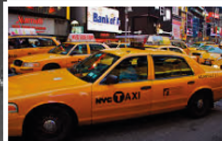
Crown Victoria - Yellow Cab Taxi NYC