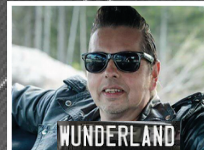
"Hugsten" kjent fra TV2 serien, Wunderland