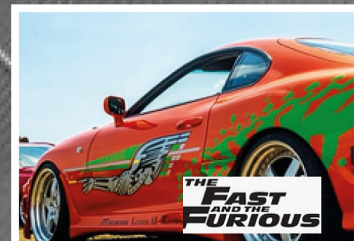
Biler inspirert av Fast & Furious