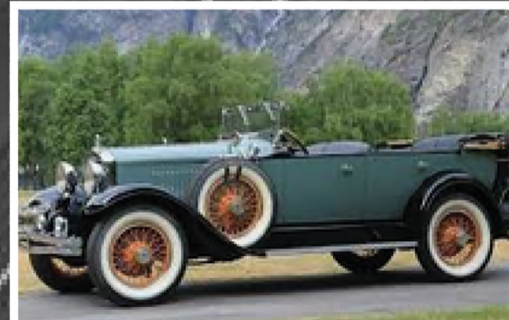
Verdens eneste 1929 Hupmobile Phateon